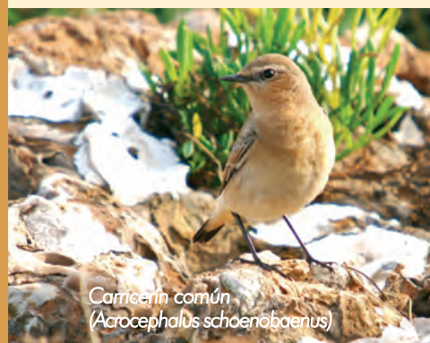
Carricera común ( Acrocephalus schoenobaenus )

El Parque Natural destaca por albergar durante el invierno y durante las migraciones otoñales un enorme contingente de aves ligadas a los medios acuáticos, que puede alcanzar los 20.000 individuos.