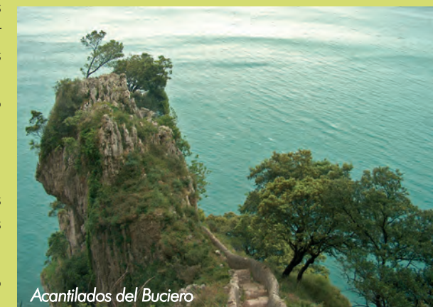
Acanitlados del Buciero

El encinar con sus praderías y cuevas circundantes alberga una variada comunidad de mamíferos como zorros ( Vulpes vulpes ), ginetas ( Genetta genetta ), tejones ( Meles meles ), etc. y quirópteros como el murciélago mediterráneo de herradura ( Rhinolophus euryale ) y el murciélago ratonero grande ( Myotis myotis ). En los ambientes acuáticos próximos hemos de citar algunas especies de anfibios como el tritón alpino ( Triturus alpestris ), la ranita de San Antonio ( Hyla arborea ) y el tritón jaspeado ( Triturus marmoratus ). El lagarto verdinegro ( Lacerta schreii ) es uno de los reptiles de mayor interés para su conservación en el Parque.