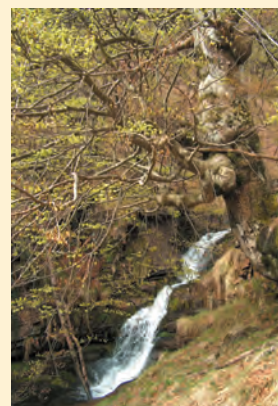
▶ Arroyo Rolacías

Norte del arroyo Rolacías, con un desnivel aproximado de 1.200 metros. La pendiente es continua, con la única excepción del rellano de Entrelusa, a la altura de las cabañas del Chumino.